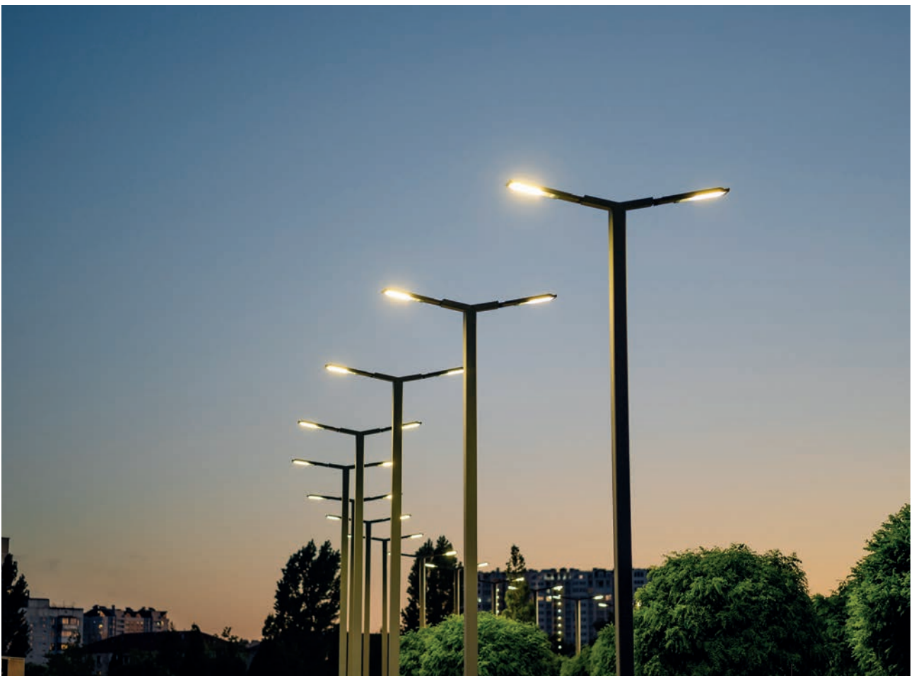
L'Agglomération poursuit en 2024 ses travaux pour rénover l'éclairage public.

C'est le volume total des dépenses étudiées dans le cadre du budget vert 2023 (contre 341 M€ en 2023)