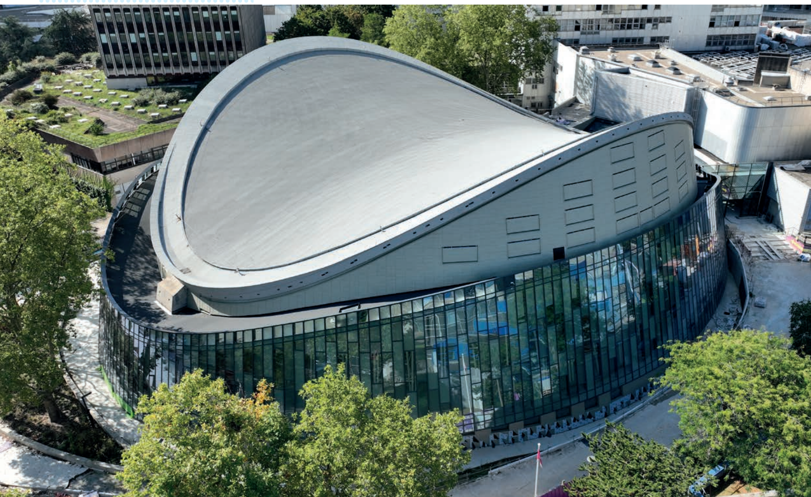
La mythique salle des Arènes, à Évry-Courcouronnes, a été inaugurée en avril 2024

Sénart, les 25 ans de l'Empreinte et la Fête du Carré. Parmi les nouveaux équipements et projets qui ont été dévoilés ou qui aboutiront cette année, citons la salle des Arènes, la place de l'Agora et celle des Terrasses à Évry-Courcouronnes, la gare routière à Savigny-le-Temple, les centres-villes d'Etiolles et de Corbeil-Essonnes, commune qui a aussi vu son quartier des Tarterêts entamer sa rénovation, ou encore les médiathèques Queneau, à Ris-Orangis, et Baker, à Bondoufle. Se dessinent aussi à travers ce budget 2024 des chantiers à venir, tels que le volet 2 du Plan Vélo, doté d'une enveloppe annuelle de 2M €, ou encore la rénovation du stade nautique Jean Bouin, à Savigny-le-Temple, ou celle de la Coupole, à Combs-la-Ville. Autre priorité : la relation aux communes et aux habitants, avec la carte unique dans les piscines et le catalogue commun dans les médiathèques du réseau, ainsi que les moyens mis en œuvre pour continuer à développer le service public de l'eau et à optimiser la collecte et le traitement des déchets.