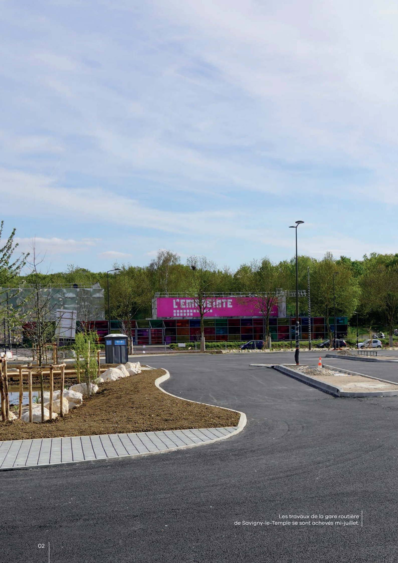
Les travaux de la gare routière de Savigny-le-Temple se sont achevés mi-juillet.