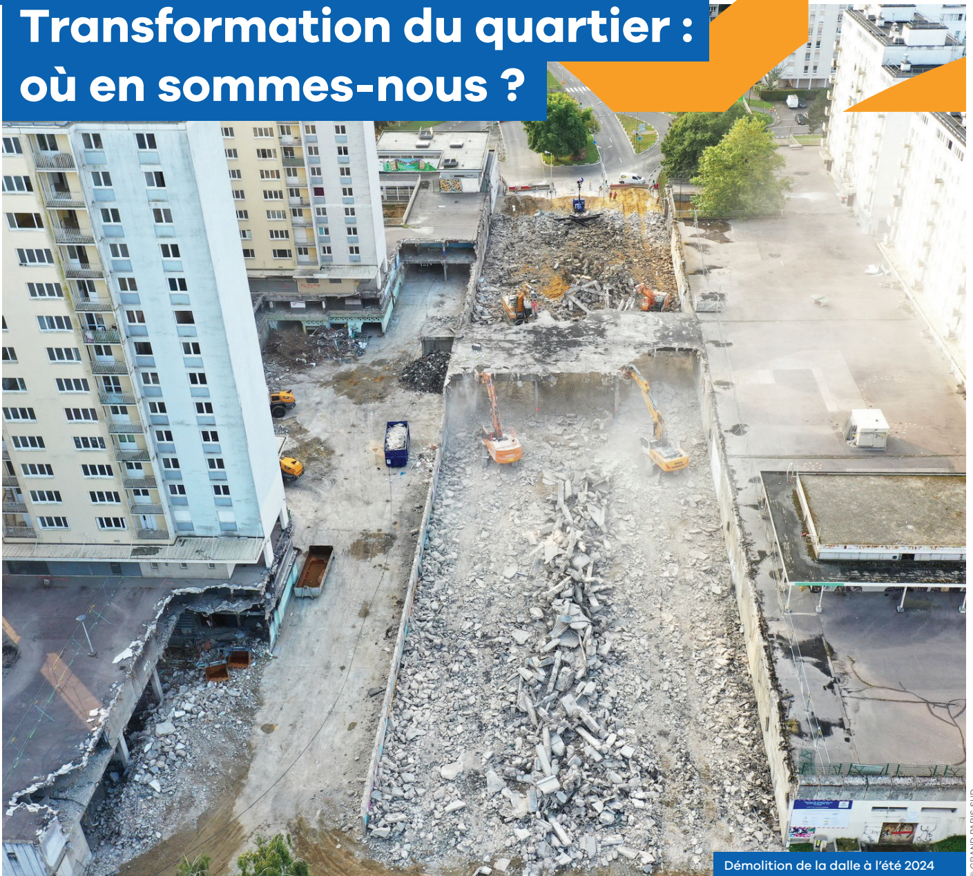
Démolition de la dalle à l'été 2024