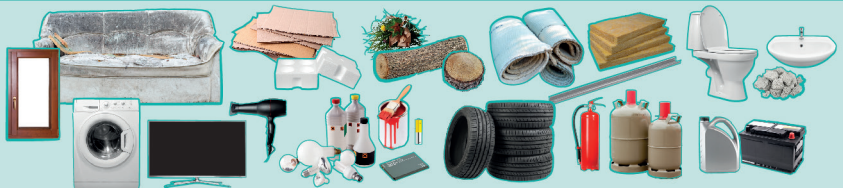
Objets volumineux, déchets végétaux, cartons, appareils électriques et électroniques, déchets dangereux, déchets de travaux, sanitaires, bouteilles de gaz, extincteurs, huiles de vidanges, batteries...

Trouver une déchèterie ? dechets.grandparissud.fr