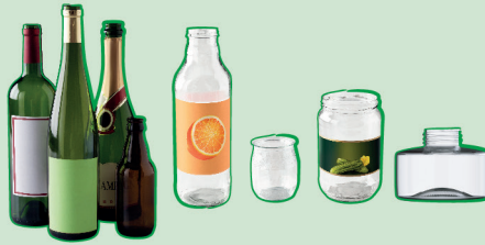
Bouteilles, pots, bocaux, flacons... en verre

Mettre le verre en VRAC sans sac, sans bouchon ni couvercle, à l'intérieur des bornes d'apport volontaire dédiées