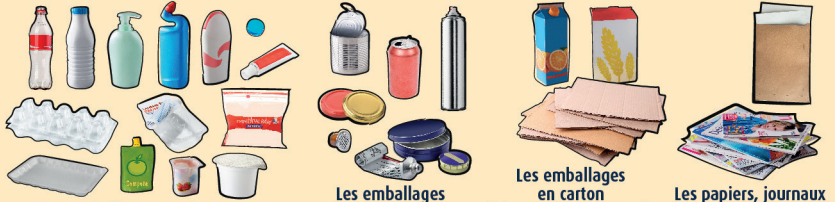
Les emballages en plastique

Déposer les emballages vides et papiers, en VRAC, dans la poubelle ou la borne, sans les mettre à l'intérieur d'un sac