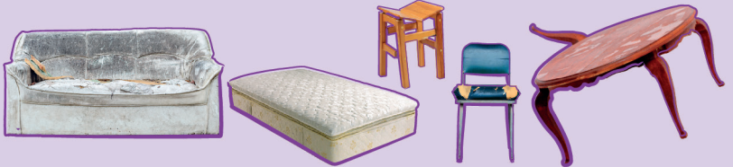
Objets dits volumineux inférieurs à 2 m de long et 30 kg - Le mobilier doit être démonté.