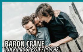
BARON CRÂNE ROCK/PROGRESSIF/PSYCHE

Baron Crâne s'est formé autour d'un amour inconditionnel pour les explosions sonores et les musiques atypiques. Depuis 2014, le power trio se développe sans cesse et expose sa musique, organique et viscérale, dans de longues compositions instrumentales. La narration, l'expérience technique et l'improvisation sont mises au service de l'émotion. Oscillant entre headbang et concentration aiguë, le public de Baron Crâne, aussi éclectique que les influences du groupe, se laisse surprendre, entraîner et bringuebaler d'un climat à un autre.