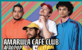
AMARULA CAFÉ CLUB AFROPOP

Ecouter Amarula Café Club, c'est comme accoster sur un nouveau rivage. On y est accueilli par des rythmes festifs, des chants un peu sorciers et des grappes de notes jouées par une guitare agile qu'on soupçonne africaine. On est un peu désorienté, loin de ce qu'on connaît, mais on se sent bien. Quelle langue parle-t-on ici ? De l'anglais, avec des relents d'accents sud-africains ou malgaches et où claquent des onomatopées. Le son et le sens y sont intimement liés.